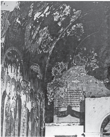
Uszkodzone przez wilgoć freski na ścianie soboru stan w roku 1923, przed przystąpieniem do burzenia świątyni (ze zbiorów archiwum Warszawskiej Metropolii Prawosławnej).