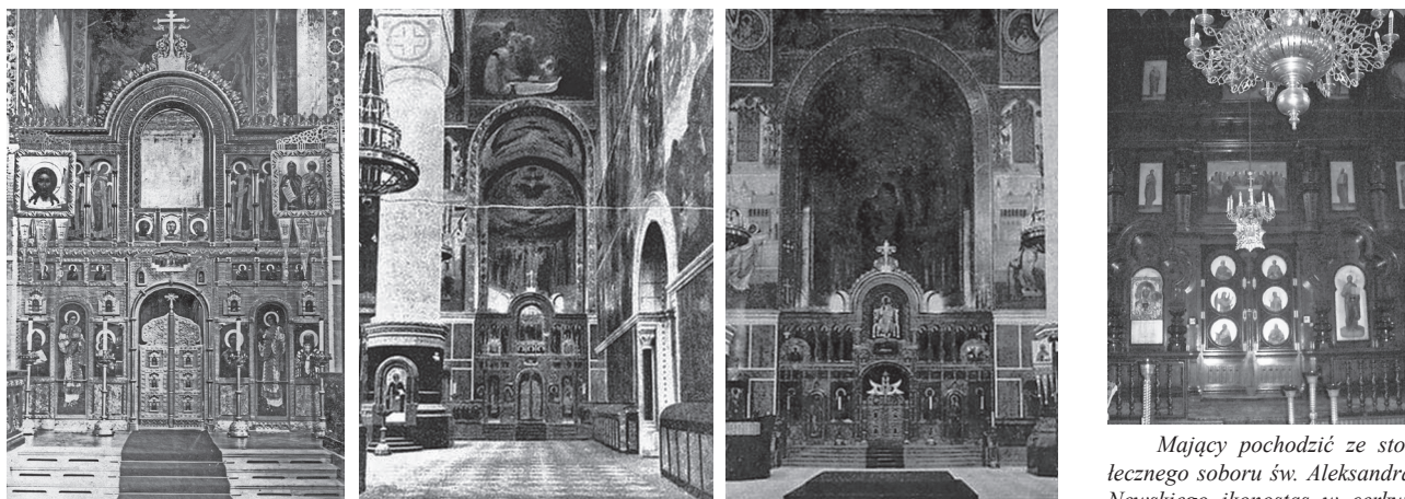
Ikonostasy soboru św. Aleksandra Newskiego w roku 1913.

Mający pochodzić ze stoletniego soboru św. Aleksandra Newskiego ikonostas w cerkwi w Kamieńcu.