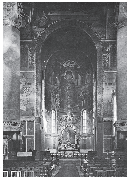
Część ołtarzowa soboru po zorganizowaniu w nim świątyni katolicko-protestanckiej – stan z około 1919 roku (ze zbiorów archiwum Warszawskiej Metropolii Prawosławnej).