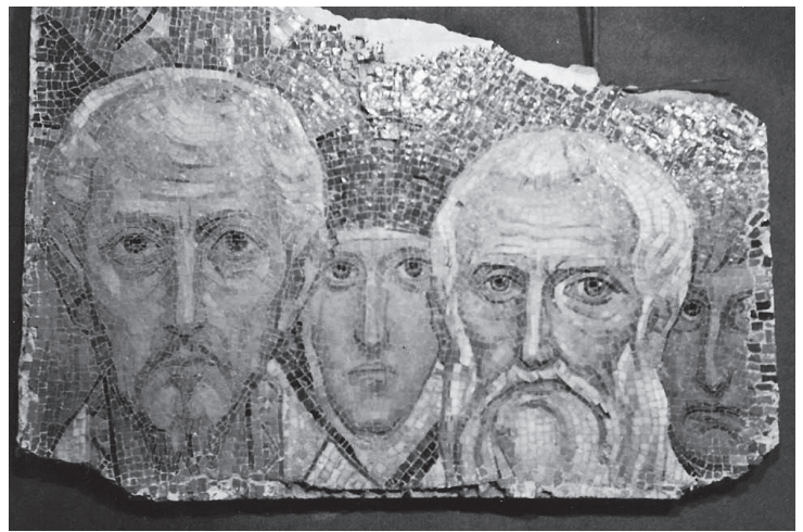
Fragment mozaiki znajdującej się w zbiorach Muzeum Narodowego.