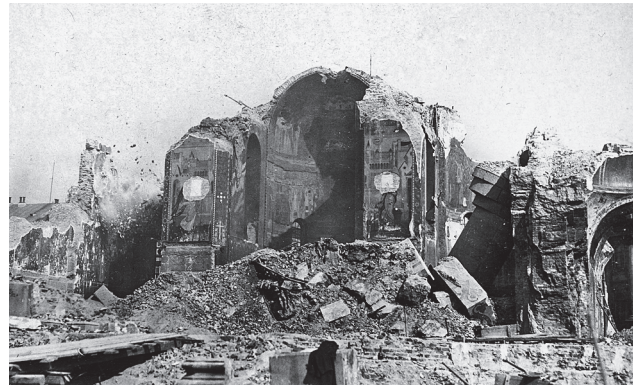
Absyda ołtarzowa soboru z wyraźnie widocznymi wykuciami fragmentów mozaiki Wasniecowa (ze zbiorów archiwum Warszawskiej Metropolii Prawosławnej).