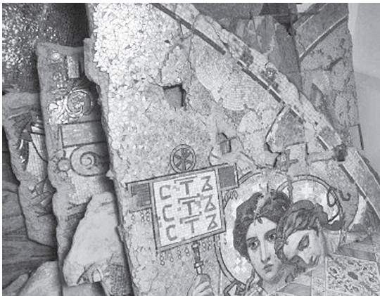
Niewykorzystane fragmenty mozaiki przywiezione z Warszawy i przechowywane w cerkwi w Baranowiczach.