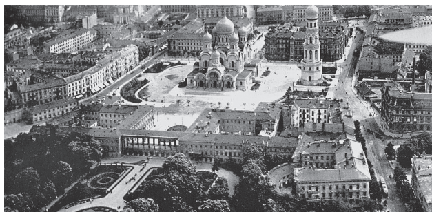
Sobór św. Aleksandra Newskiego w Warszawie około 1914 roku. Zdjęcie lotnicze.