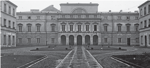
Dziedziniec Pałacu Paca wyłożony płytami granitowymi pochodzącymi ze ścian soboru. Rok 1934 (fot. Leon Jarumski, ze zbiorów Narodowego Archiwum Cyfrowego).