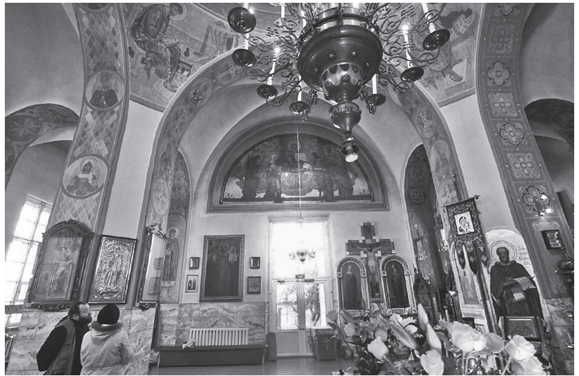
Fragmenty odtworzonych mozaik w cerkwi w Baranowiczach.