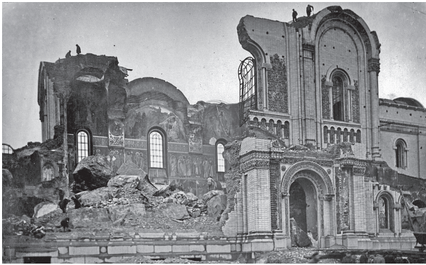
Burzenie soboru w roku 1925. Na ścianie frontowej widoczne otwory po nieskutecznie odpalonych ładunkach wybuchowych.