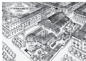
Cerkiew Αγία Παρασκευή w XV w.

odprawił nabożeństwo dziękczynne za odniesione zwycięstwo. Na jednej z kolumn bazyliki zachował się napis po turecku: „sułtan Murat zajął Saloniki w 1430 roku” 20 . W 1487 r. meczet został odrestaurowany pod nadzorem dowódcy tureckiego. Prawdopodobnie wtedy został usunięty drugi stopień dachu z lunetami. Przez cały okres panowania tureckiego cerkiew Αχειροποιήτου była głównym meczetem w mieście. Meczet miał swą nawę: “Εσκι Τζουμά τζαμι tj. meczet piątkowej modlitwy. Może dlatego Grecy określają tę świątynię mianem św. Paraskiewy (Αγία Παρασκευή). Meczet funkcjonował do 1912 r., tj. do wyzwolenia Salonik.