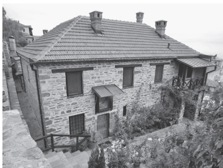
Typikarnica w XIX w. i w chwili obecnej

Karejski Typikon jest jednym z najważniejszych dokumentów w historii religijnej literatury serbskiej. Na 115 wierszach św. Sawa opracował szczegółowe zasady modlitwy, postu i kultu liturgicznego, które miały być realizowane przez mnichów zamieszkujących kielię. Typikon był wzorowany na starożytnych zasadach i modlitwach ascetów, którzy żyli na pustyniach w Egipcie, Synaju i Palestynie. Podczas pobytu św. Sawy Serbskiego w Typikarnicy miejsce to określano jako „słup ortodoksji”. Trwała tu ciągła modlitwa, powstawały nowe pieśni, hymny ku chwale Boga w Trójcy Świętej. Zgodnie z przyjętą regułą w Typikarnicy trwa całodobowa modlitwa za świat, czytany był Psalterz i ewangelie. Święta liturgia sprawowana była jedynie raz w miesiącu. W kielii nikt nie ma władzy: ani protos, ani ihumen, ani inny brat. Obowiązuje tu mil-